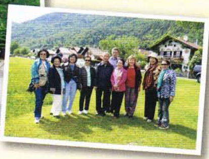
เมืองโอเบอร์ามาเกา

ปราสาทนอยชวานสไตน์ (Neuschwanstein) เมืองฟิสเซ่น ปราสาทในฝันของกษัตริย์ลูตวิกที่ ๒ ตั้งบนโตรกผาในเทือกเขาแอลป์ สูง ๒๐๐ ม. ทรงวางแผนอย่างพิถีพิถันให้เหมือนฉากละครในอุปรากรของ วากเนอร์ ใช้เวลาก่อสร้างไม่น้อยกว่า ๑๗ ปี งดงามเหมือนปราสาทในเทพนิยาย แต่พระองค์ประทับอยู่ในปราสาทที่ทรงรักมากที่สุดเพียง ๑๘๔ วันเท่านั้นก็สวรรคต เป็นมรดกอันล้ำค่าแห่งแคว้นบาวาเรีย