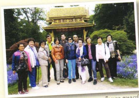
เมืองบาด ฮอมบวร์ก

ศาลาไทยที่เมืองบาด ฮอมบวร์ก สถาปัตยกรรมไทยอันงามสง่าที่รัชกาลที่ ๕ ทรงโปรดเกล้าฯ ให้สร้างครอบรอบน้ำโกนิจจุฬาลงกรณ์ เมื่อ พ.ศ. ๒๔๕๒ เพื่อเป็นเครื่องรำลึกถึงความสำราญที่พระองค์ทรงได้รับเมื่อเสด็จฯ มาพักผ่อนและรักษาพระวรกายด้วยน้ำ (spa) ที่เมืองนี้เป็นเวลา ๑ เดือน วันที่ ๒๓ ส.ค. - ๒๒ ก.ย. ๒๔๕๐ ในระหว่างการเสด็จประพาสยุโรปครั้งที่สอง พ.ศ. ๒๔๔๙ - ๒๔๕๐