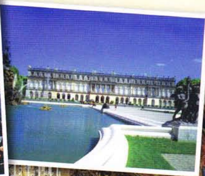
ปราสาทแฮเรนคิมเซ The Ambassador Staircase บันไดทางขึ้นที่หรูหรา