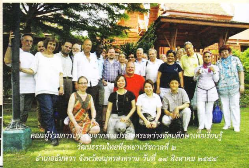
คณะผู้ร่วมการปฐมนิเทศจากต่างประเทศระหว่างที่นักศึกษาเพื่อเรียนรู้วัฒนธรรมไทยที่อุทยานรัชกาลที่ ๒ อำเภออัมพวา จังหวัดสมุทรสงคราม วันที่ ๑๔ สิงหาคม ๒๕๕๔