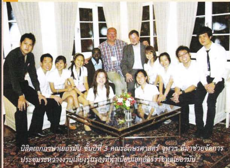
นิตินอกภาษาเยอรมัน ชั้นปีที่ ๓ คณะอักษรศาสตร์ จุฬาลงกรณ์มหาวิทยาลัย ช่วยจัดการประชุมระหว่างงานเลี้ยงรับรองที่ทำเนียบเอกอัครราชทูตเยอรมัน