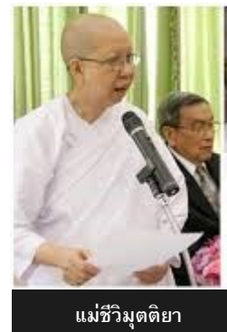
แม่ชีวิมุตติยา

สวนอุศุมจัด “เรื่องเล่าจากพระไตรปิฎก” ให้บุคคลทุกเพศทุกวัย มารับฟัง ในเวลา 13.00-14.30 น.ของวันที่สองของการจัดอบรมปฏิบัติธรรมแต่ละครั้ง กิจกรรมนี้ไม่ต้องสมัครล่วงหน้า