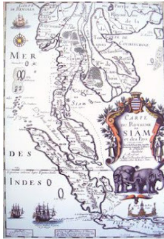
แผนที่อาณาจักรอยุธยาฉบับฝรั่งเศส