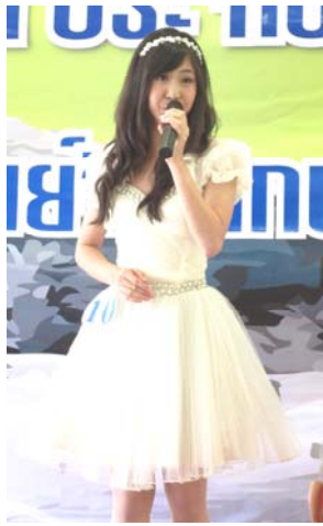
ลีลาการโชว์พลังเสียงของผู้ชนะ

สถาบันขงจื่อแห่งมหาวิทยาลัยบูรพาจัดการประกวดโครงการแข่งขันขับร้องเพลงจีน (ภูมิภาคตะวันออก) ประจำปี 2555 ขึ้น เมื่อวันที่ 21 กรกฎาคม 2555 ณ สถาบันขงจื่อและศูนย์จีนศึกษา มหาวิทยาลัยบูรพา