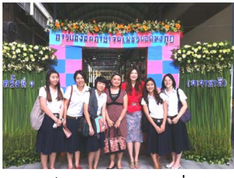
อาจารย์และนิสิตร่วมถ่ายภาพที่ระลึก

สาขาวิชาภาษาจีนได้คัดเลือก ฝึกซ้อมนิสิต เพื่อเข้าร่วมการแข่งขันภาษาจีนเพชรยอดมงกุฏ (นานาชาติ) ระดับอุดมศึกษา ครั้งที่ 7 จัดโดยมูลนิธิธรรมจักรร่วมกับมหาวิทยาลัยราชภัฏสวนสุนันทา เมื่อวันที่ 26 สิงหาคม 2555 ณ มหาวิทยาลัยราชภัฏสวนสุนันทา กรุงเทพฯ นิสิตที่เข้าร่วมการแข่งขันและได้รับรางวัลมีดังนี้