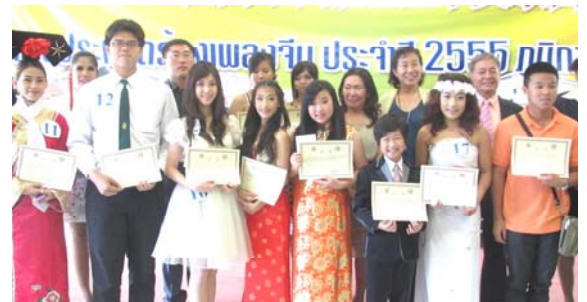
ผู้ชนะรางวัลต่าง ๆ บันทึกภาพร่วมกัน