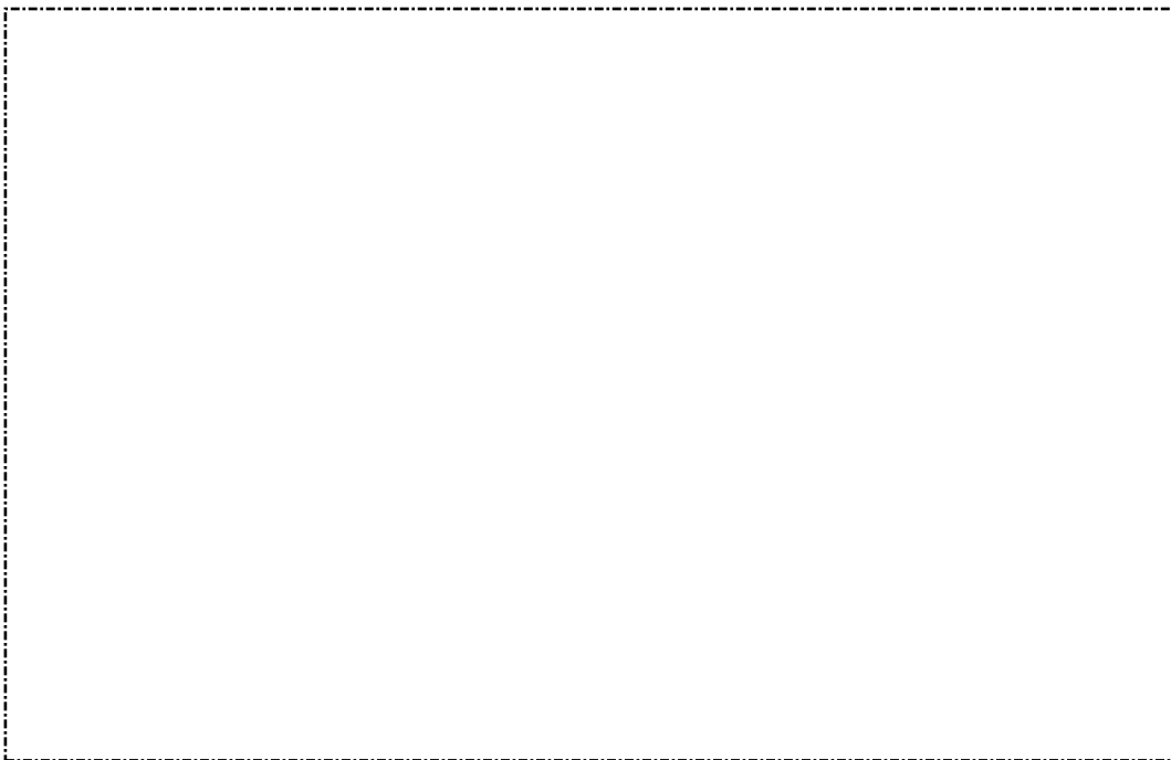
รูปที่ 4 สภาพทรัพย์สินต่าง ๆ